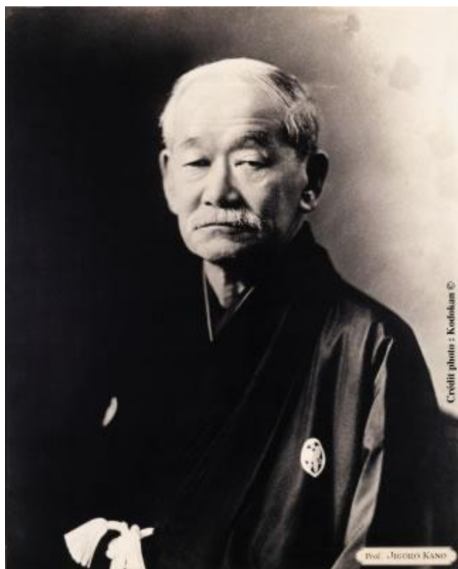
Jigoro Kano – ustanovitelj juda