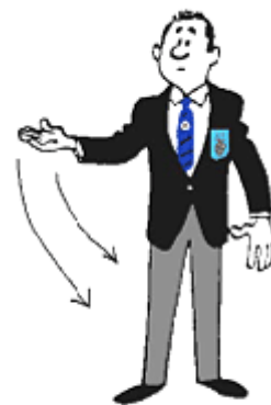
POZIV ZA ZDRAVNIKA